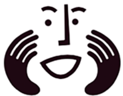
Logo von Geplaper, Illustration von Anna Weber