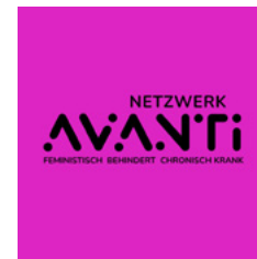
Mitgliederversammlung beim Netzwerk Avanti

rung ihr Leben selbstbestimmt leben können – unabhängig von Geschlecht, Behinderung, Sexualität, Herkunft, Alter, sozialer Stellung oder anderen persönlichen Merkmalen. Die Umsetzung der UNO-Behindertenrechtskonvention und der Istanbul-Konvention ist nach wie vor unvollständig. Barrierefreie Frauenhäuser, inklusive Bildung und ein diskriminierungsfreier Arbeitsmarkt bleiben aus. Auch die Anerkennung der reproduktiven Rechte von FLINTA* mit Behinderungen fehlt. Ihnen wurde lange Zeit selbstbestimmte Sexualität, Schwangerschaft und Elternschaft abgesprochen. Diese Fremdbestimmung führte damals wie heute noch zu Zwangssterilisationen. Wir fordern das Recht auf selbstbestimmte Sexualität und Elternschaft. Dazu gehört auch, dass die Medizin und die Forschung uns mitdenkt und aufhört, männliche, weisse, able-bodied Körper als «Norm» zu sehen. Wir fordern ein Leben frei von Gewalt und Diskriminierung. Internationale Studien zeigen, dass FLINTA* Personen mit Behinderung besonders oft von Gewalt betroffen sind. In der Schweiz