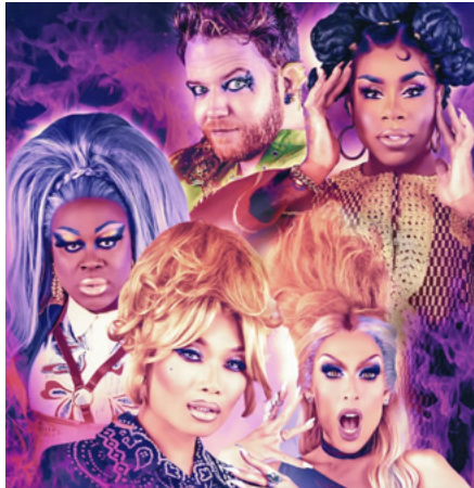
Dungeons and Drag Queens, erste Folge auf Youtube, den Rest auf Dropout, Dimension 20, 4 Episoden und Extras

Dadurch gibt es reichlich Momente zum Lachen – und zum eventuellen Taschentuchzücken beim Finale.